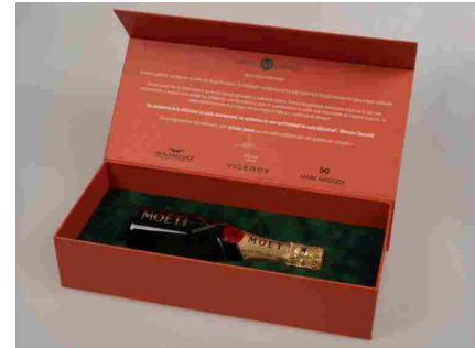
Grupo Munreco, un brindis junto a sus clientes

Un ejemplo de marca sostenible que podrá disfrutarse en la próxima edición es Nedumo Jewels : en lugar de desaparecer, el pasado se puede reinventar y reutilizar, tal como lo hace Nedumo Jewels con la madera flotante de barcos antiguos, creando joyas imaginativas que combinan los estragos del tiempo con