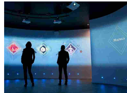
Cuatro candidatas contraofertan por Majorica