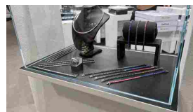
FRANCESCA BIANCHI DESIGN