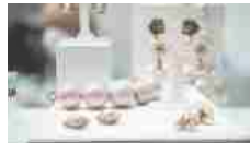
Horri Fashion&Jewels conferma la volontà di ripresa del settore 14/10/2020 In "Fiere"