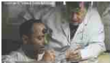
A Milano le Giornate Europee dei Mestieri d'Arte 2014 24/03/2014 In "Iniziative"