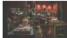
Una notte al Museo del Gioiello di Vicenza alla scoperta delle sue bellezze 21/06/2017 In "Eventi"