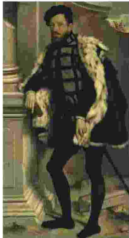
A sinistra, G.B. Moroni, ritratto A destra Fede Galizia, Paolo Morigia

Nel «Ritratto di Paolo Morigia» realizzato da Fede Galizia, la figura tiene in mano, quasi porgendoli allo spettatore, un paio di occhiali che ampliano il dipinto riflettendo la scena: DaTE, che degli occhiali è vetrina alternativa, è il riferimento elettivo. Una luce caravaggesca illumina la protagonista del dipinto di Giuseppe