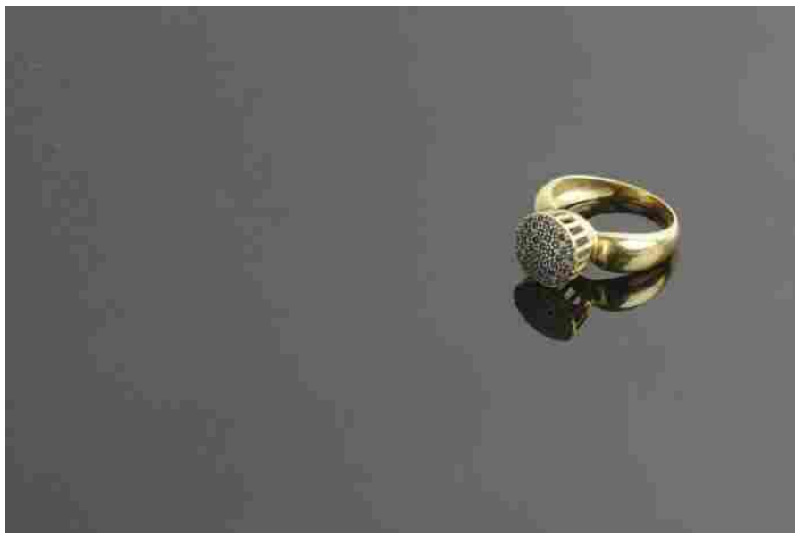
La Fiera del Bijoux dal 16 al 19 settembre a Milano.

Sta per riaprire i battenti la Fiera del Bijoux (Homi Fashion&Jewels Exhibition) che permette di conoscere le prossime tendenze di tutti gli accessori del mondo della moda. In questo modo sarà più facile trovare i prossimi trend che si adattano al proprio stile. L'evento è in programma dal 16 al 19 settembre a Fiera Milano (Rho). Con la collaborazione di Poli.Design, la manifestazione si soffermerà su bijoux e accessori di tendenza dei prossimi mesi, soprattutto dell'Autunno-Inverno 2022.