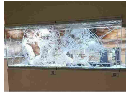
Violento robo en la feria de arte de Maastrich