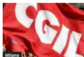
Cgil, Fp, Spi: Pnrr, salute e territorio