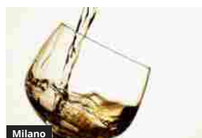
Stoppani (Epm): Milano Wine Week, bere consapevole