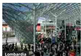
“Carbon Neutral”, torna “Homi Fashion & Jewels Exhibition” in Fiera